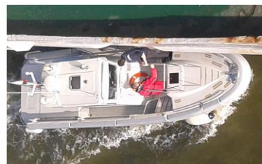
16 aprile ci si sveglia ancora fermi ma infine si parte ... e il pilota se ne va