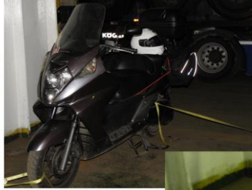
Che non decida di andarsene!