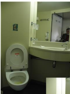
Prenotato posto letto in cabina da 4 letti al costo di 100 euro Assegnata cabina singola con bagno privato