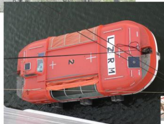
Riparazioni alla scialuppa di salvataggio